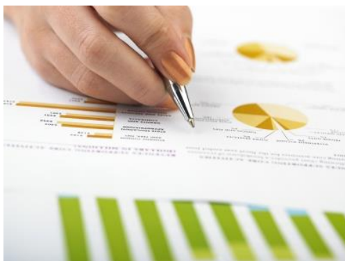
Análisis de datos estadísticos.